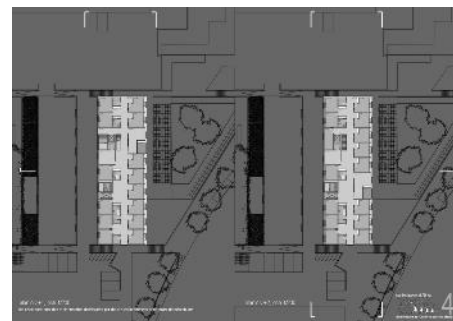
Plan niveau 1