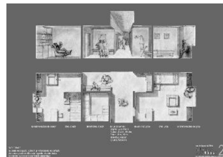
Coupe perspective et plan des chambres

Le niveau principal du projet donne aujourd'hui à l'ouest côté parc public. Il abrite l'entrée du nouveau bâtiment et une terrasse à l'ouest. Au niveau inférieur se trouvent les espaces collectifs, des dépôts et des locaux de services. Les espaces domestiques (chambres, sanitaires, soins, etc.) se situent aux niv+1 et niv+2. Chaque étage a un accès indépendant depuis le niv.0 ce qui banalisera l'accès aux niveaux d'habitation. Le projet garanti en outre une certaine flexibilité dans le temps, les étages supérieurs pouvant être reconvertis ultérieurement en appartements protégés.