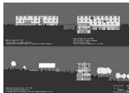
Façades et coupes