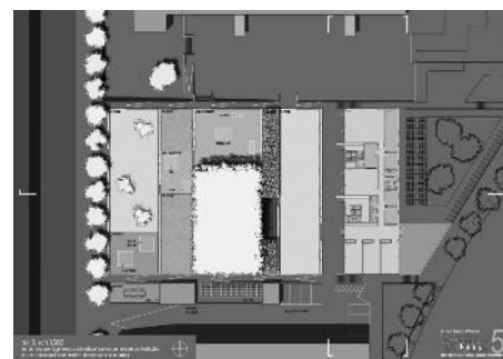
Plan niveau 0