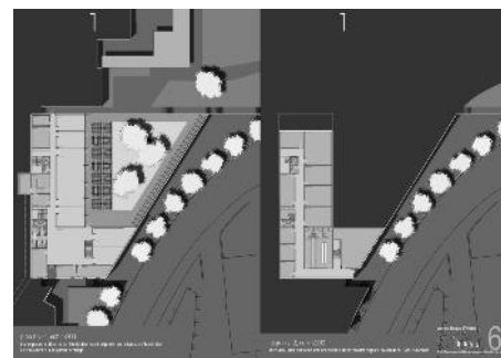
Plan niveau -1